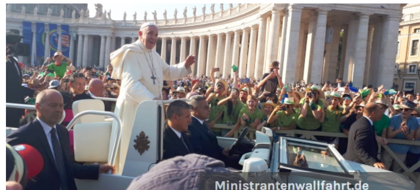
Ministranten bei der Papst-Audienz, Foto: Bistum Fulda, Bistum Augsburg, 2018