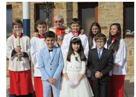
Erstkommunionkinder 2018 in Treysa (links) und in Zimmersrode (rechts)