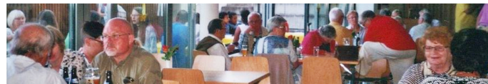
Schnappschüsse: Grillfest in Treysa (2) und Verabschiedung in Zimmersrode (or).