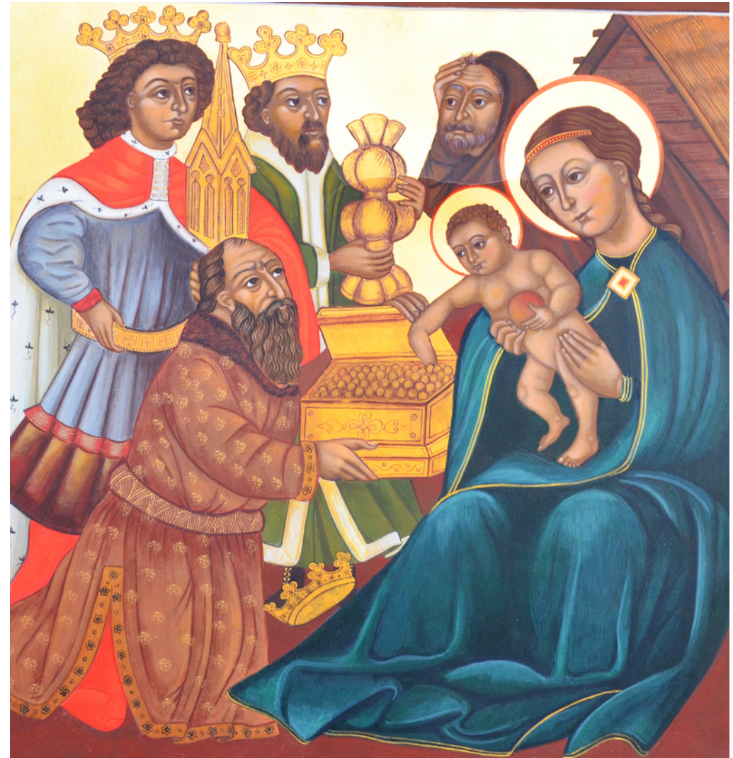
Anbetung der Weisen aus dem Morgenland von Hildegard Rall