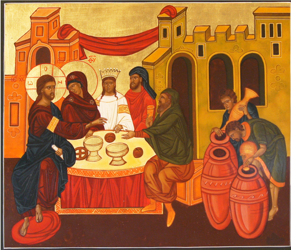
Bei der Hochzeit zu Kana verwandelt Jesus Wasser in Wein

Den Völkern soll zum Zeichen sein: der Stern, das Wasser und der Wein