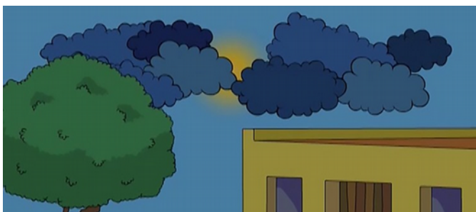
Mit lautem Brausen kam der Heilige Geist auf die Erde hinab.

Jesu Freunde, die Apostel, trafen sich zum Pfingstfest. Sie saßen in einem Haus zusammen und feierten. Plötzlich kam vom Himmel ein lautes Brausen, das sich anhörte wie ein Sturm.