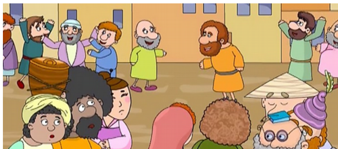
Manche machten sich lustig über die Apostel, andere waren erstaunt - aber Petrus ermahnte sie: Die Apostel hatten keinen Unsinn erzählt.

Der Heilige Geist erschien den Aposteln als Flammen aus Feuer. So konnten sie ihn dann doch sehen. Danach sollten sie allen von Jesus und Gott erzählen. Sie sollten allen sagen, dass sie sich taufen lassen sollten, um zu Gott zu gehören. Sie sollten an Gott glauben und allen von seiner Liebe erzählen. In Jerusalem gab es aber Menschen aus vielen verschiedenen Ländern. Fast jeder sprach eine andere Sprache. Damit aber jeder die Apostel verstehen konnte, machte der Heilige Geist, dass sie jede Sprache sprechen konnten. Sofort rannten sie aus dem Haus und erzählten jedem die Geschichte von Jesus.