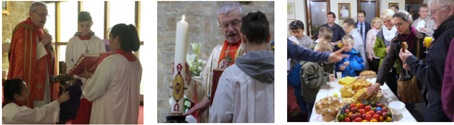
Kreuzverehrung (Karfreitag), Osterkerze und Osterfrühstück (Agape)