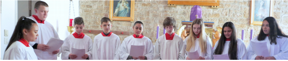
Die Ministranten lesen die Passion, die Leidensgeschichte Jesu Christi