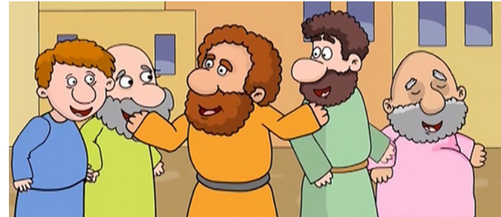
Nun feierten alle zusammen ihren Glauben. Sie beteten, lobten und dankten Gott gemeinsam.

Als die Leute das hörten, tat es ihnen leid, dass sie zuvor über die Apostel gelacht hatten. Sie glaubten nun, was ihnen gesagt wurde. Und sie wollten nun auch zu Jesus gehören und den Heiligen Geist spüren. Sie alle ließen sich auf den Vater, den Sohn und den Heiligen Geist taufen. Sie waren nun eine Gemeinschaft, die an Gott glaubte. Sie erzählten allen, die sie trafen, von Gott. Tausende Menschen wollten auch zu der Gemeinschaft gehören. Daher ließen auch sie sich sofort taufen. So konnten sie ebenfalls durch den Heiligen Geist gestärkt werden. Sie alle waren nun Christen.