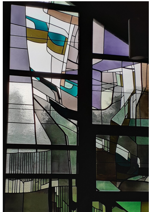
(übertragen aus der Kirche Bad Hersfeld-Johannesberg und eingebaut von Fa. Rhiel, Amöneburg)