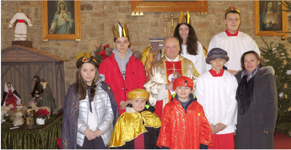
Sternsinger in St. Peter, Neumental-Zimmersrode, Foto: Privat