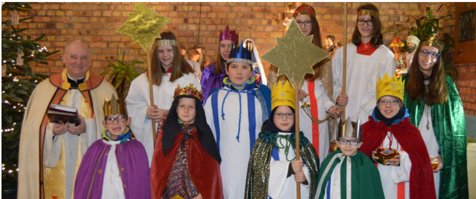
Sternsinger in der Heilig-Geist-Kirche Treysa