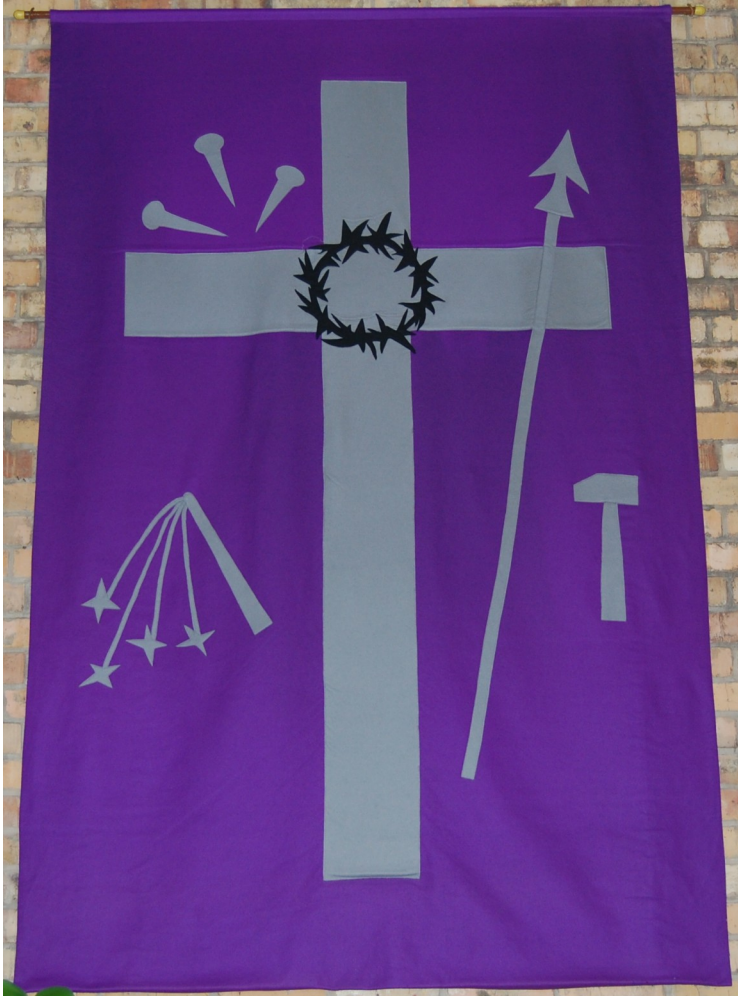
Fasten- und Passionstuch (Treysa) mit Leidenswerkzeugen Kreuz, Geißel, Nägel, Hammer, Lanze, Dornenkrone

Fasten- und Passionszeit - Februar/März 2022